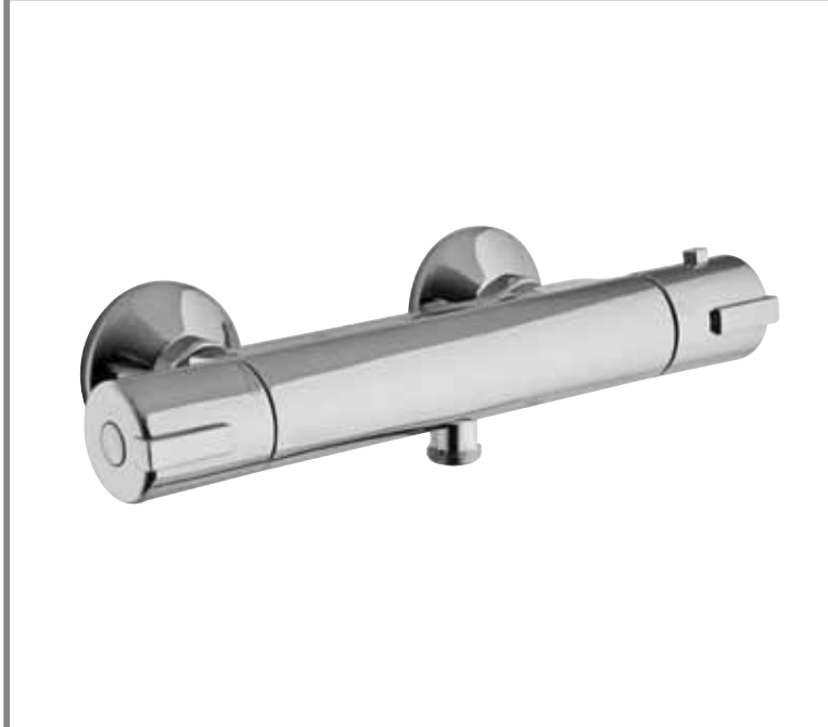
> Cod. F4075/1CR