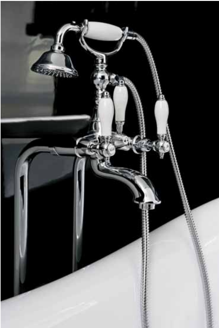
> Cod. F5404/4CR