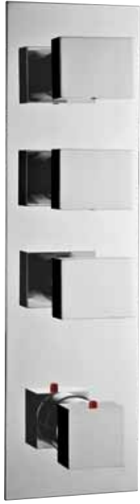
> Cod. F3513/3CR