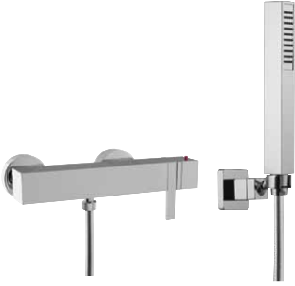
> Cod. F4045CR