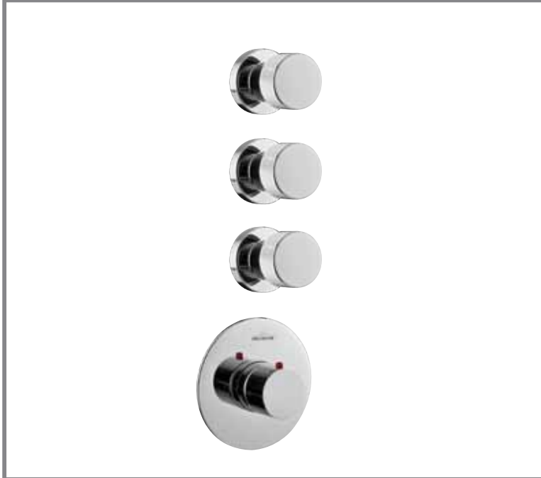
> Cod. F3253/3CR