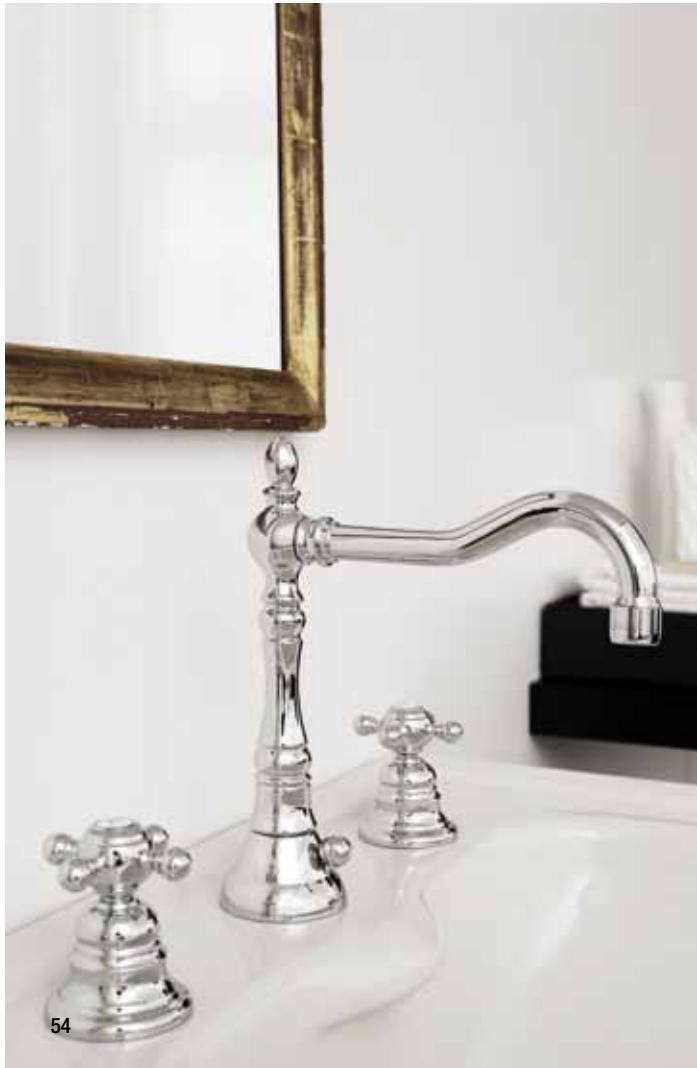
> Cod. F5081CR