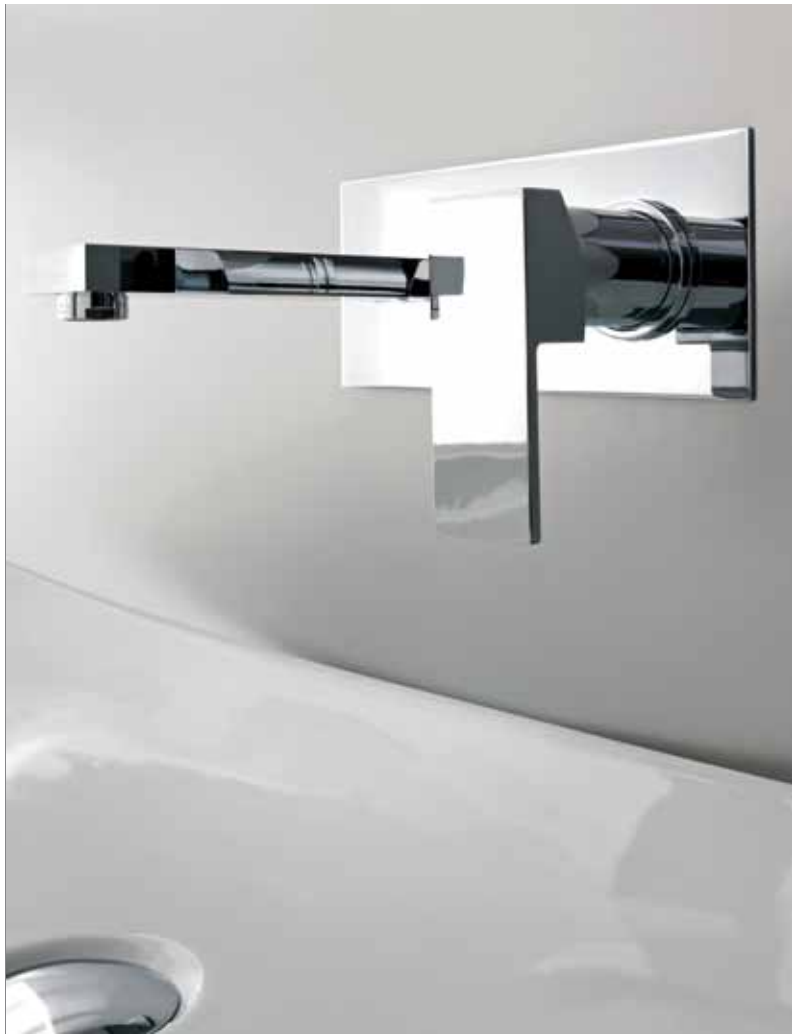
> Cod. F3631/5CR