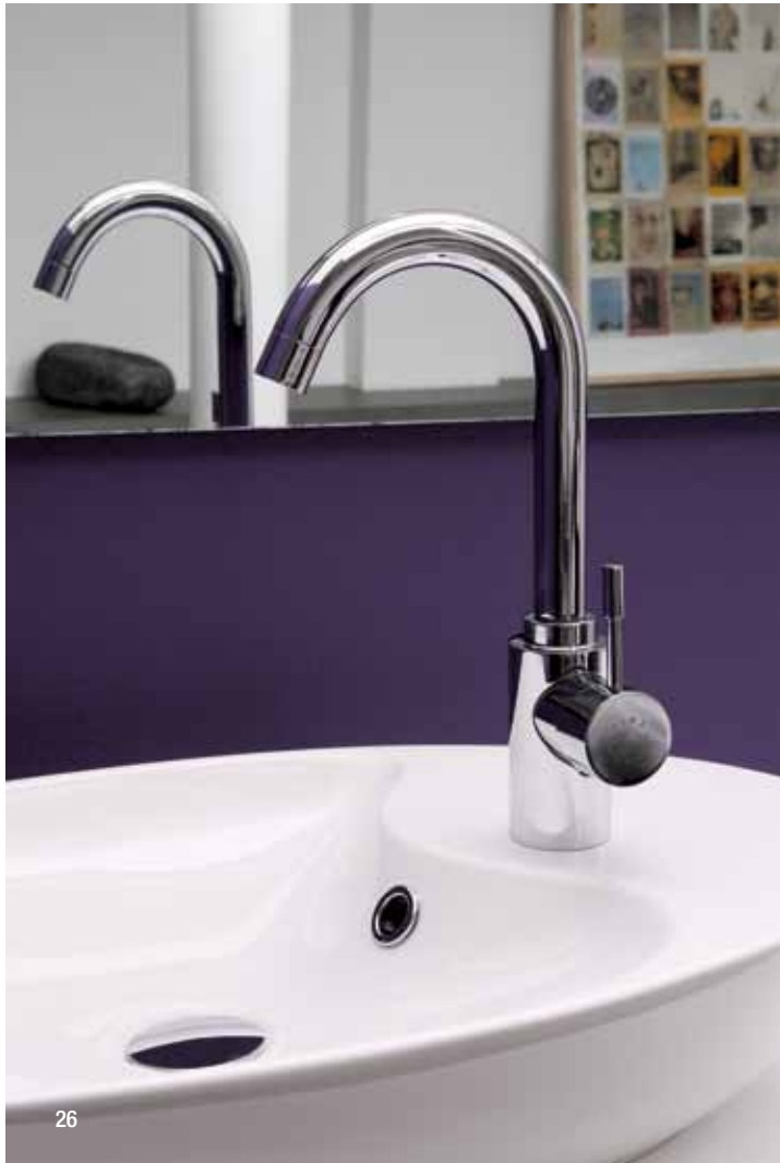
> Cod. F3261CR