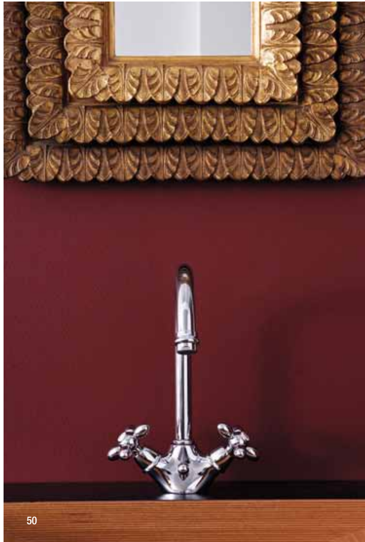
> Cod. F5021CR