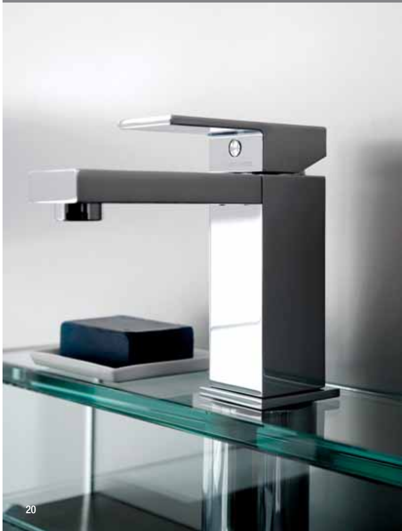
> Cod. F3511CR