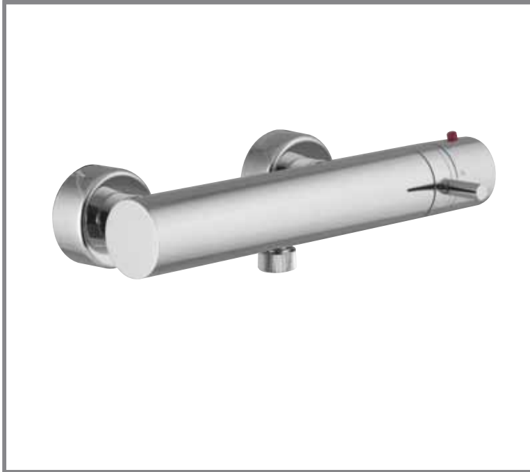
> Cod. F4035/1CR